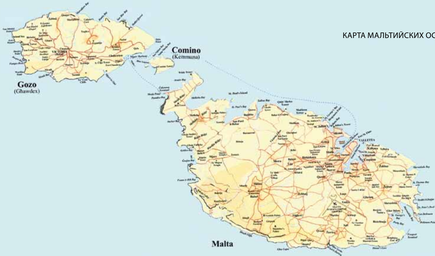
КАРТА МАЛЬТИЙСКИХ ОСТРОВОВ